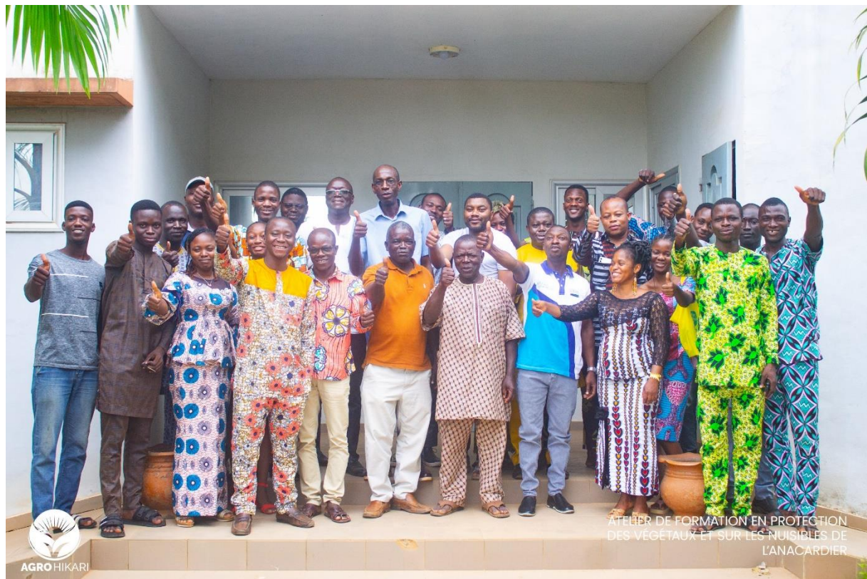
DAY 1 Group photo