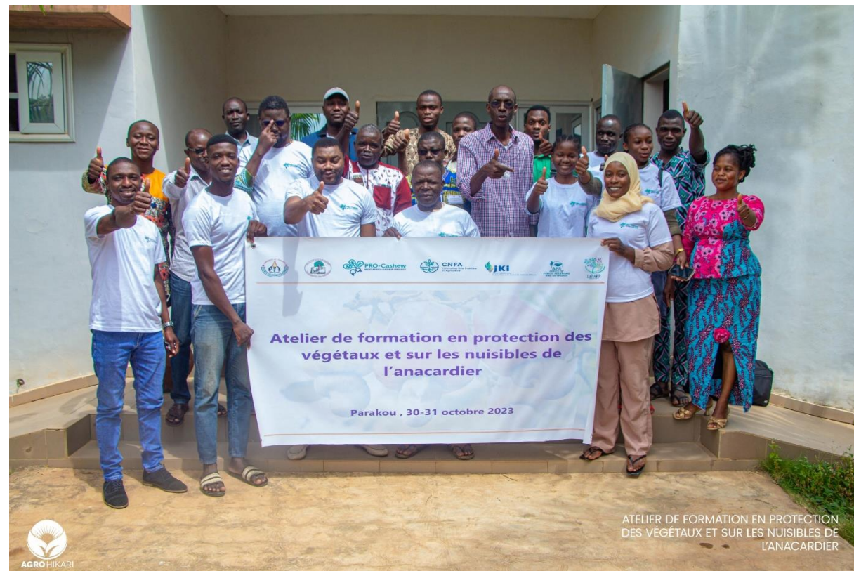
DAY 2 Group photo