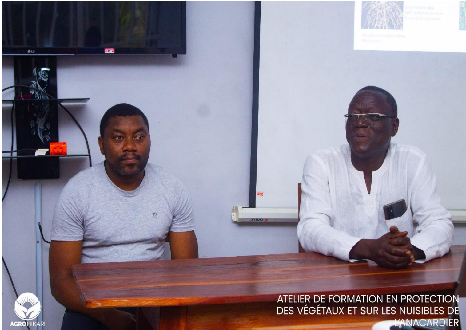
HoD Welcomed Participants